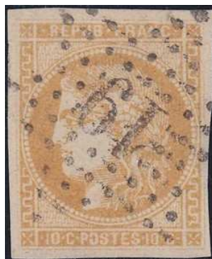
Oblitération étoile chiffrée