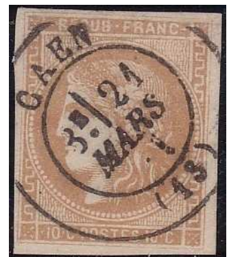
Oblitération cachet à date