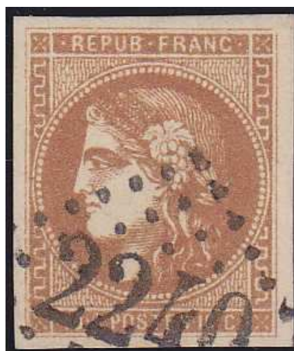
n°43A nuance bistre brun foncé