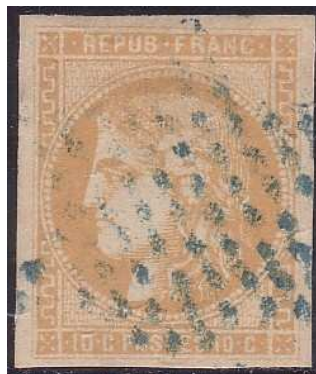
Oblitération étoile bleue