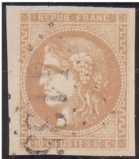
n°43A nuance bistre