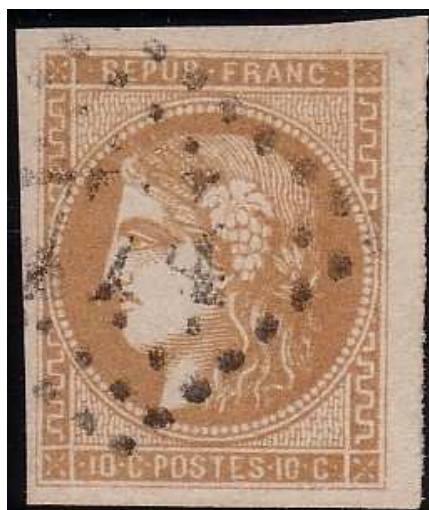
n°43A nuance bistre brun