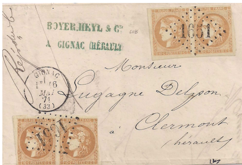
n°43A sur lettre, double port national de Gignac