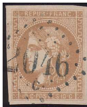
Oblitération GC bleus