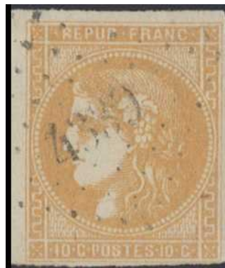
Oblitération petits chiffres