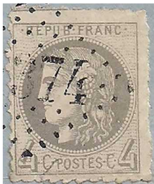
n°41B "percé en lignes" sur lettre d'Etaules