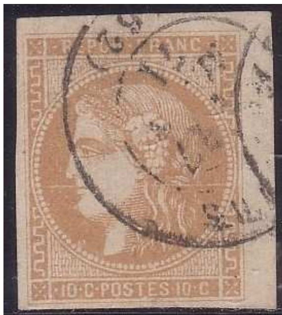
n°43A grande griffe blanche horizontale

L'usage postal du 10 centimes Report 1 : il faudrait une étude de grande ampleur pour détailler tous les cas d'utilisation postale du timbre, en y incluant les tarifs d'avant et d'après le 1er septembre 1871, les imprimés et assimilés, et surtout les hypothèses les plus fréquentes de "complément d'affranchissement". Mais pour faire simple, l'immense majorité des documents affranchis grâce au timbre à 10 centimes relèvent de 2 catégories de "lettres ordinaires" au tarif local ayant cours jusqu'au 31 août 1871 et les « lettres ordinaires » au tarif national à 20 centimes, avec une paire ou deux exemplaires du timbre à 10 centimes, pour pallier un manque de timbres à 20 centimes.