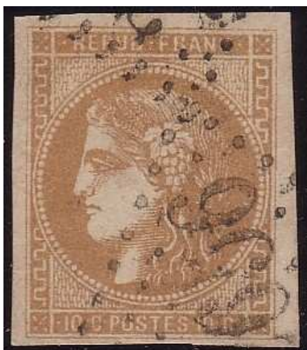
n°43A nuance brun