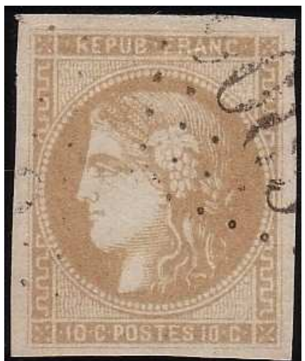
n°43A nuance bistre verdâtre