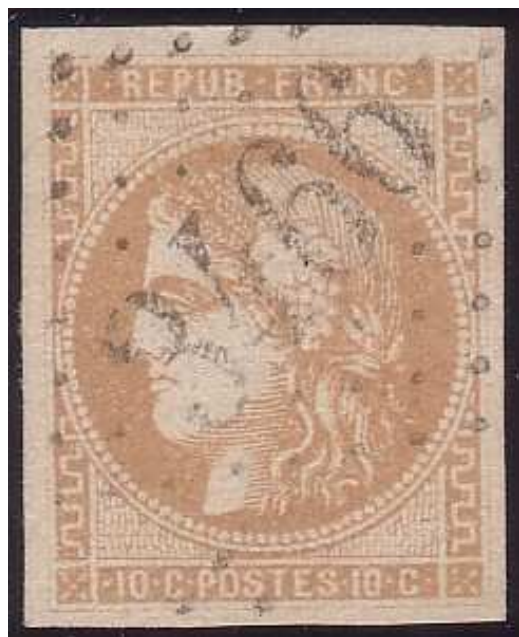
n°43A filets du cadre manquants

Les variétés d'impression du 10 centimes Report 1 ne manquent pas. Les timbres aux "filets du cadre manquants" ou aux "ombres sous l'oeil réduites" ne sont pas des raretés, sans doute trouvera-t-on ce type d'anomalies plus souvent que sur les autres valeurs. Mais certainement il faudra plus parler de "défauts d'impression occasionnels" que de "variétés classiques".