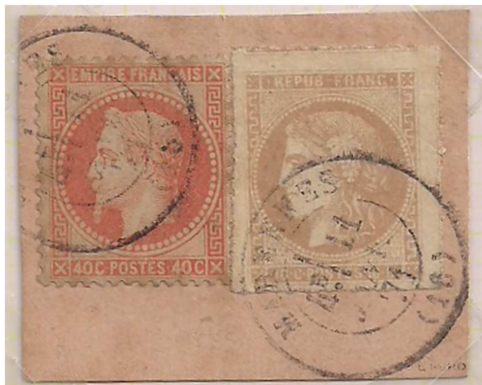
n°43A "percé en lignes de Marennes" sur fragment, avec le 40centimes Empire lauré

On le voit, une étude reste à faire , pour lister les bureaux concernés de façon complète, et pour dégager au plus près la rareté des pièces. L'enjeu des cotes n'est autre, bien souvent, que de permettre des échanges équitables, en considération notamment des raretés comparatives. Ici, l'on ne peut que tâtonner, et les longues réflexions ci-dessus, à ne pas voir comme de simples "visions de marché", correspondent à des incertitudes dommageables pour la philatélie elle-même, la philatélie de ce domaine, qui reste bien délaissé. C'est là un cercle vicieux auquel il faut remédier. Moyennant des recherches approfondies, on établirait par exemple des cotes incontestables, à base solide, qui seraient du reste appelées à vite progresser, avec un intérêt grandissant.