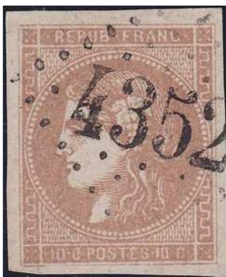
n°43A nuance bistre rougeâtre