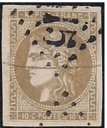
n°43A nuance verdâtre foncé