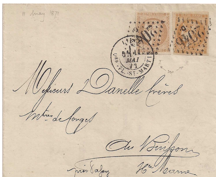
n°43A et n°43B sur lettre de Lille, rare utilisation des deux Reports