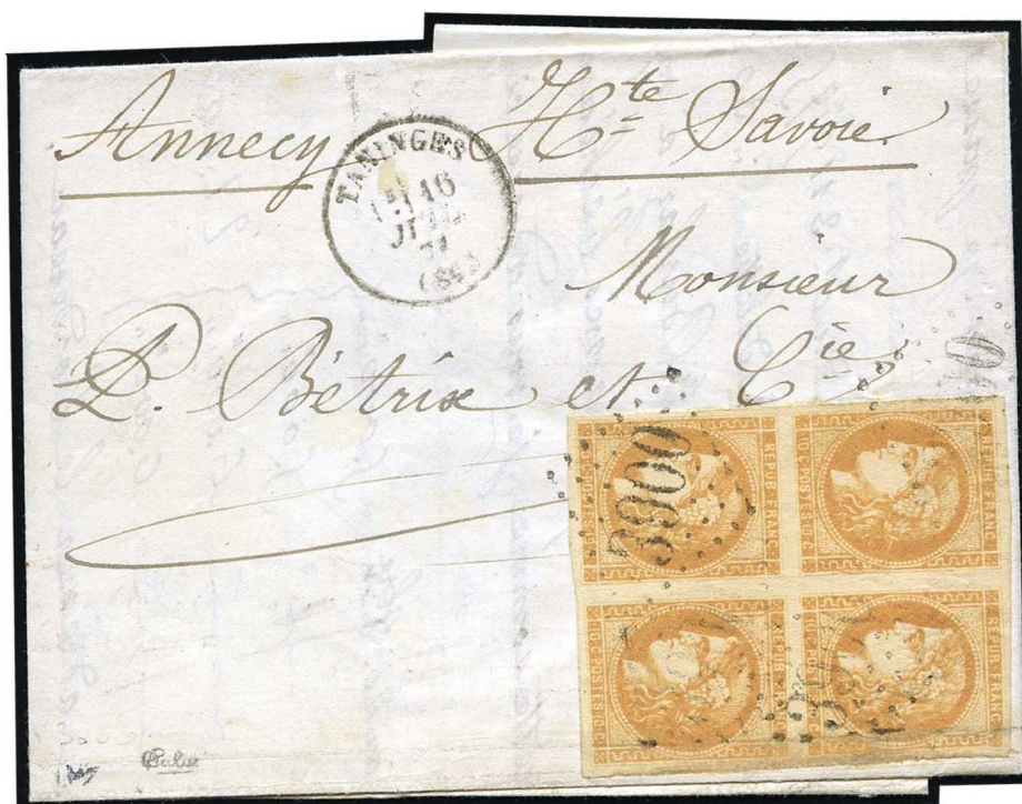
n°43B bloc de 4 sur lettre de Taninges (vente sur offres Behr)

Existe-t-il de "grands ensembles" à l'image du bloc-report intégral, bloc de 15 donc, découvert à l'état neuf ? Le "plus grand bloc connu" oblitéré serait un bloc de 10 pour le 10 centimes Report 1 et un bloc de 6 pour le 10 centimes Report 2, d'après le catalogue Yvert Spécialisé de 1974, mais nous sommes dans l'exception comme les quelques pièces de prestige du catalogue Yvert Spécialisé de 2000 qui présente 2 lettres double port, affranchies au moyen de bandes de 4. Ce sont des raretés !