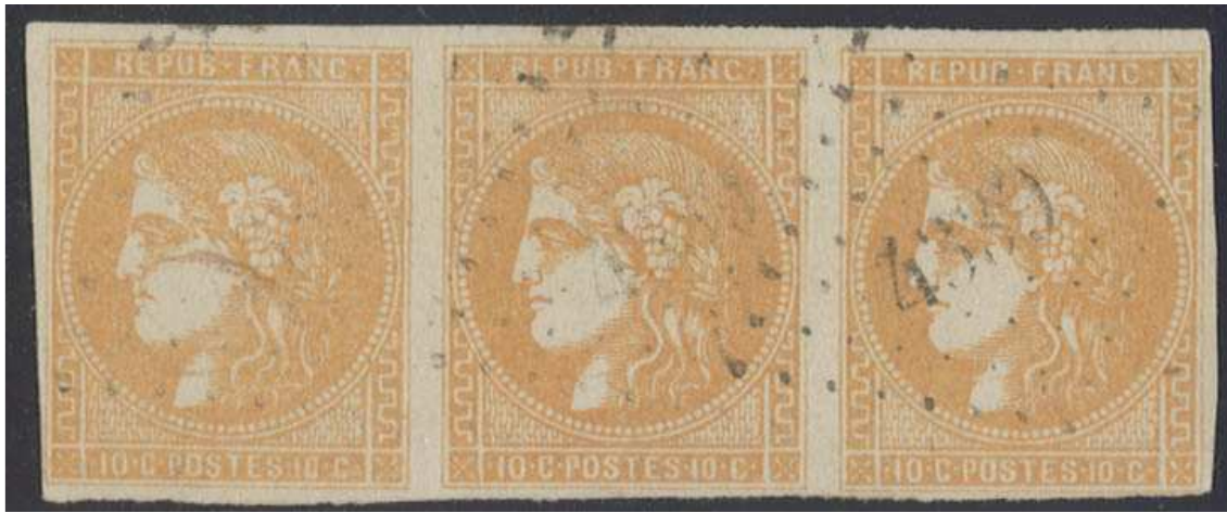
n°43B bande de 3 (vente sur offres Roumet)