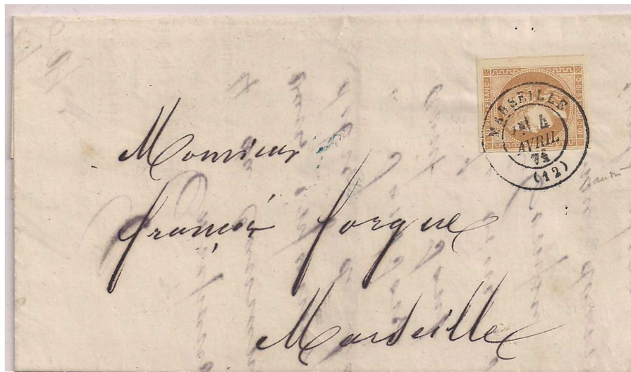
n°43A seul sur lettre de Marseille au tarif local