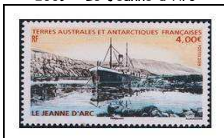
2009 - Le Jeanne d'Arc