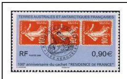
2009 - Résidence de France