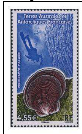
2009 - Programme "Macarbi"