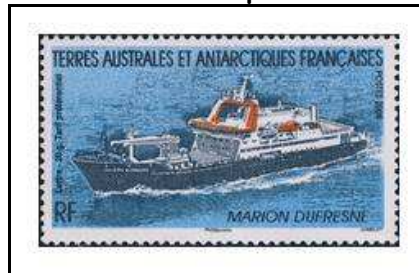
2009 - L'espérance