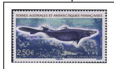
2009 - Requin