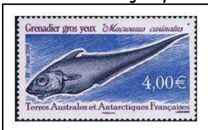
2008 - Grenadier gros yeux