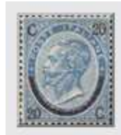
n°22a (Type II)