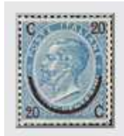
n°22 (Type III)