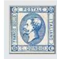
n°11a (1 er tirage)