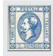
n°11 (2 e tirage)