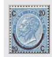
n°22b (Type I)

Dans le Type II, il y a un petit point blanc sur et sous l'étoile qui se trouve de chaque côté dans l'ovale de l'encadrement ; dans le Type III, il y a en plus un petit point blanc dans les 8 dessins en forme de crochet qui terminent les ornements des coins.