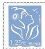
N° Y&T : 4156 Année : 2008