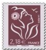
N° Y&T : 4158 Année : 2008