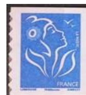
N° Y&T : 4127 Année : 2008