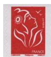
N° Y&T : 3744b Année : 2006