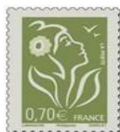
N° Y&T : 3967 Année : 2006