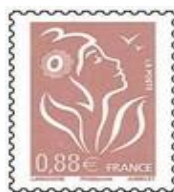
N° Y&T : 4155 Année : 2008