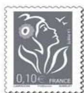
N° Y&T : 3965 Année : 2006