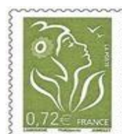
N° Y&T : 4154 Année : 2008