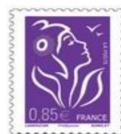
N° Y&T : 3968 Année : 2006