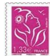
N° Y&T : 4157 Année : 2008