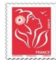
N° Y&T : 3734b Année : 2006