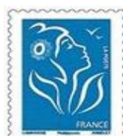
N° Y&T : 4153 Année : 2008