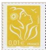
N° Y&T : 3731a Année : 2006