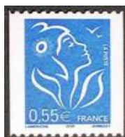
N° Y&T : 3807 Année : 2005