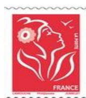
N° Y&T : 3743a Année : 2006