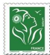
N° Y&T : 3733b Année : 2006