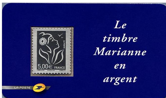
N° Y&T : 3925 Année : 2006