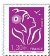
N° Y&T : 3971 Année : 2006