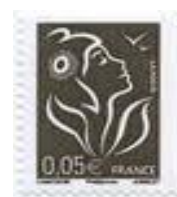
N° Y&T : 3754b Année : 2006