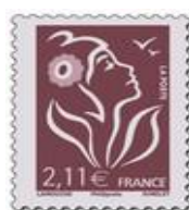
N° Y&T : 3972 Année : 2006