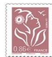
N° Y&T : 3969 Année : 2006