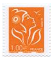
N° Y&T : 3739b Année : 2006