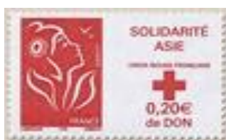
N° Y&T : 3745 Année : 2005

La Poste se mobilise en faveur des pays d'Asie touchés par le Tsunami du 26 décembre 2004 et s'associe à la Croix-Rouge Française. Ce timbre associant la Marianne des Français et une vignette « Solidarité Asie » est vendu au prix de 0.70 € dont 0.20 € sont reversés à la Croix-Rouge. Sa valeur d'affranchissement est de 0.50€.