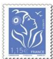
N° Y&T : 3970 Année : 2006