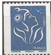
N° Y&T : 4159 Année : 2008