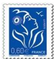
N° Y&T : 3966 Année : 2006