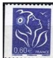
N° Y&T : 3973 Année : 2006