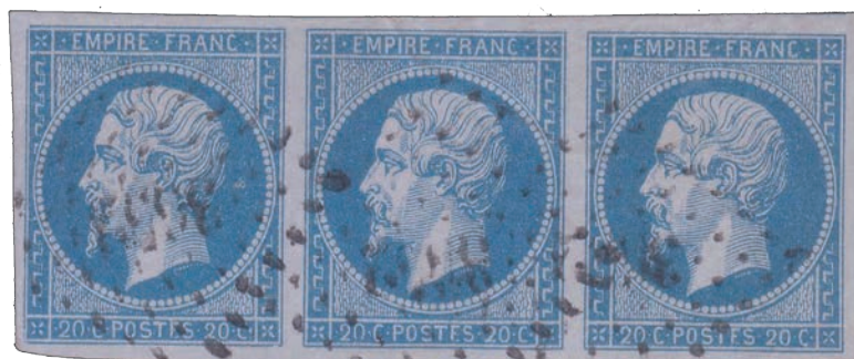
13 Bande de 3 avec 3 variétés POSTFS, positions 81D2 82D2 83D2, avec la nuance bleu sur lilas.