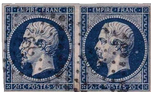
10 Une paire bleu très foncé, position 82D2 83D2.

- Docteur Fromaigeat, Les Constantes du 20 c. Napoléon non lauré non dentelé type I, étude n°48 et n°59, éditée par le Monde des Philatélistes . - Notre site internet sur le planchage des timbres bleus de France : www.planchage-france-timbres.net