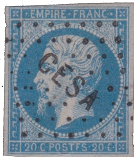
9 Une variété POSTFS oblitérée du Corps Expéditionnaire de Syrie.

●●● donc pas rare. Il est donc possible de trouver facilement des variétés POSTFS dans des lots de 20 centimes Empire non dentelés non triés. A partir des 3 194 300 feuilles émises de ce timbre, on peut estimer à environ 6 000 000 le nombre de timbres émis avec la variété POSTFS. Le prix de marché peut être estimé autour de 15 € pour un timbre oblitéré de bonne qualité dans la troisième étape de la variété. Car aussi surprenant que cela puisse paraître, la variété complète avec le E transformé en F est la plus commune ; cela s'explique par le fait que le E de POSTES s'est assez vite dégradé pour évoluer vers un E avec sa barre inférieure cassée, puis se transformant en F. La variété dans sa première étape vaut environ 40 €, alors que dans sa deuxième étape sa valeur de marché se situe autour de 25 €. Les timbres avec de très belles marges en qualité luxe peuvent atteindre des prix supérieurs à 100 €, 60 € et 40 € pour respectivement les étapes 1, 2 et 3. Mais dans ce cas, tout doit être superbe : les marges, la fraîcheur, l'oblitération et sans défaut de papier ! Ce prix abordable permet de se lancer dans une collection sans avoir trop à investir et le tri de lots de plusieurs timbres permet souvent de trouver quelques variétés POSTFS à un prix encore plus bas.