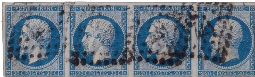
6 Bande de 4 de la variété POSTFS, 83D2, 84D2, 85D2 et 86D2, avec les 3 étapes se tenant.

Empire non dentelé, c'est-à-dire dès son émission le 1 er juillet 1854. Les premières dates connues de la variété POSTFS sur lettre sont datées d'avril 1855. La fin d'utilisation de ce panneau est estimée en février 1861. Cette variété n'est ● ● ●