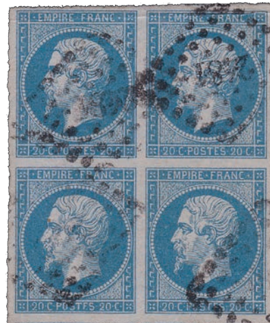
15 Bloc de 4 avec 2 variétés POSTFS, positions 66D2 67D2 76D2 77D2.