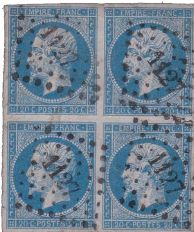
14 Bloc de 4 avec 4 variétés POSTFS, positions 78D2 79D2 88D2 89D2.