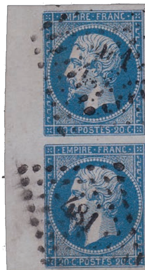
12 Une paire bord de feuille 71D2 81D2 avec variété tenant à normal