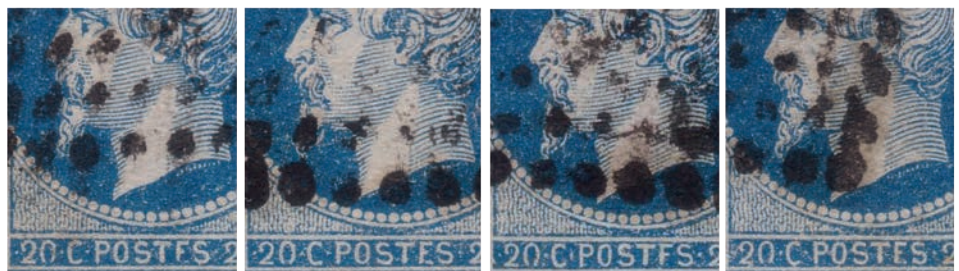
7 Zoom des repères des 4 timbres de la bande de 4, avec les 3 étapes se tenant.