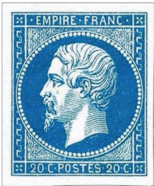
1 20 centimes Empire non dentelé au type I