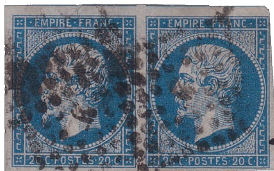
11 La seule paire horizontale possible de la variété POSTFS tenant à normal, position 73D2 74D2.