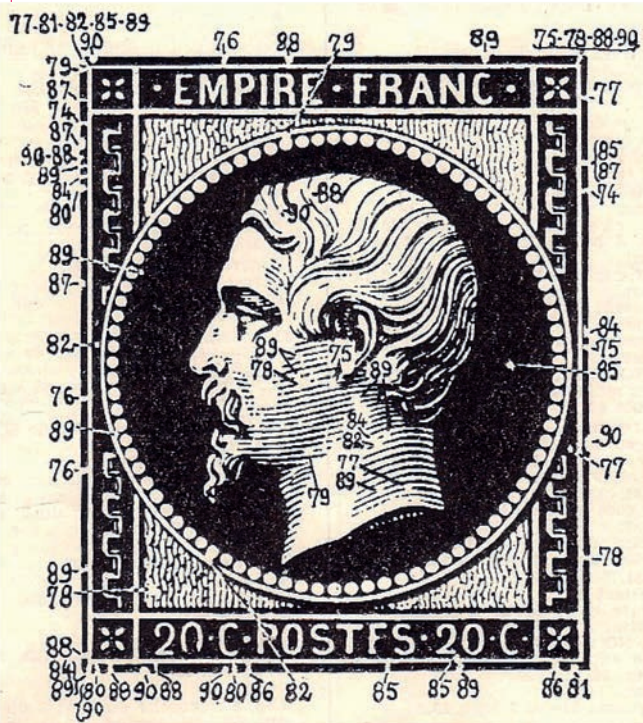
8 Schéma extrait de l'étude du Docteur Fromaigeat sur « Les constantes du 20c Napoléon non dentelé type 1 », étude n°59 éditée par le Monde des Philatélistes.