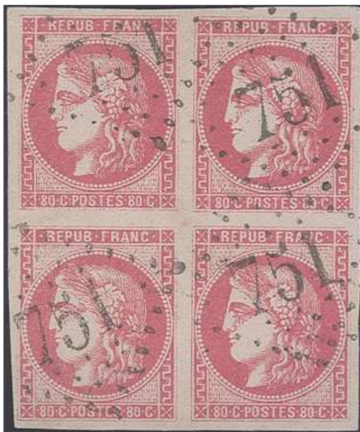
n°49 rose bloc de 4, vente sur offres Roumet

Ici, nous nous intéressons aux multiples à l'état oblitéré, bonifiés dans cette présentation à en croire les catalogues. Certes, il peut se trouver des blocs et des bandes correspondant alors aux grands affranchissements, comme ceux des lettres chargées mais les contextes d'apparition de ces multiples sont alors ceux d'une fragilité accrue des timbres : le premier choix est d'autant plus rare, d'où une bonne cote méritée. Le « plus grand ensemble connu » serait alors un bloc de 8, selon l'Yvert spécialisé de 1975.