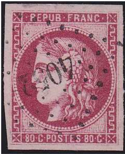
n°49 rose carminé foncé