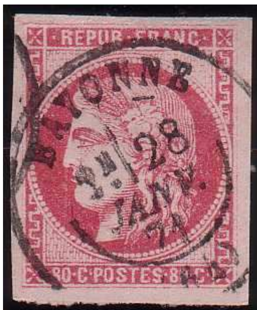
n°49 oblitération cachet à date