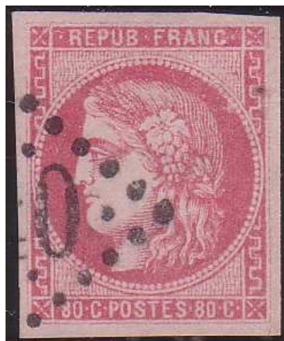
n°49 rose clair