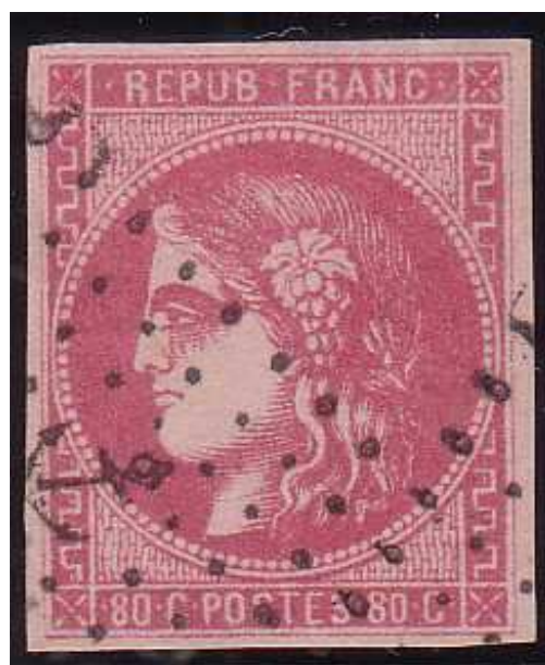
n°49 oblitération ancre