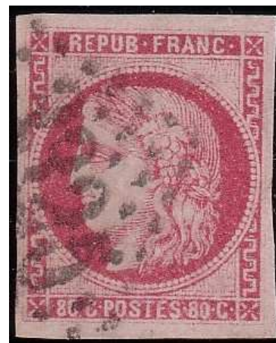
n°49 rose carminé