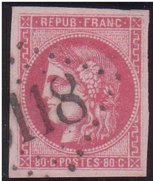
n°49 oblitération gros chiffres