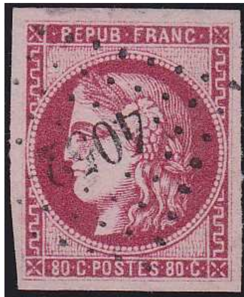
n°49 oblitération petits chiffres