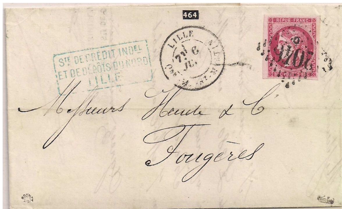
n°49 rose seul sur lettre de Lille pour Fougères

« Seul sur lettre » (lettre triple port à 80 centimes), le timbre à 80 centimes est ainsi un très bon timbre. Il en va de même pour les lettres envoyées à l'étranger, au tarif de 80 centimes (en principe : double port correspondant aux 40 centimes du port simple pour certains pays). La préférence du philatéliste est affaire de goût, mais on conçoit qu'il s'attache avant tout à présenter le 80 centimes sur un spécimen du courrier national auquel il était destiné.