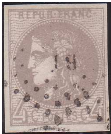
n°41B losange ambulant

Bien entendu, il existe maintes oblitérations non postales, comme pour le 2 centimes – mais peut-être a-t-on encore davantage été tenté d'y avoir recours, du fait de la teinte du 4 centimes, particulièrement intéressante pour « mettre en valeur » des cachets de couleur ou autres oblitérations « de fantaisie » : la vigilance est donc de rigueur.