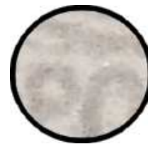
Pas de petit trait parasite au dessus des lettres P et O de POSTES n°41A