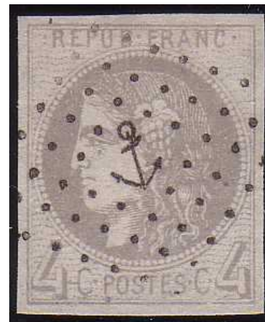
n°41B ancre (signé Brun)