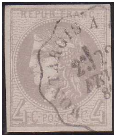
n°41B cachet convoyeur station