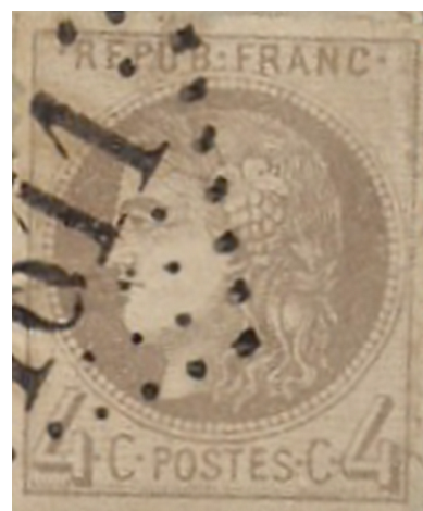
Gaillac du Tarn (Tarn) : lettre nationale à 25 c. ( pour Toulouse, le 13 septembre 1871) (nouveau tarif du 1 er septembre 1871)