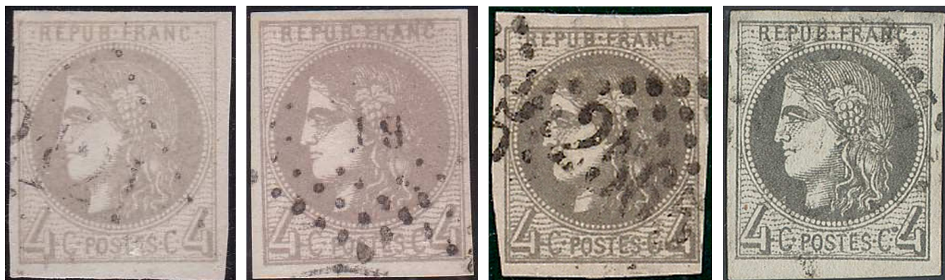
n°41B gris jaunâtre

teinte de base, nous est connu à différentes intensités, celles qui justifient vraiment le qualificatif de « gris-noir », voire « gris très foncé », étant rares. La teinte violacée appelée « gris-lilas » peut être plus ou moins appuyée, mais, bien marquée, n'est pas si commune. Le « gris-jaunâtre » est, lui, fréquent.