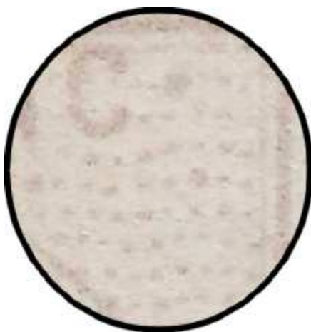
Burelage du n°41A